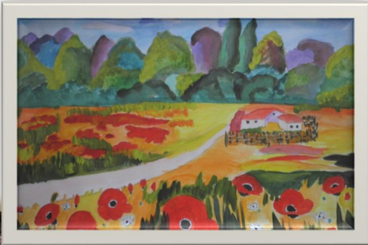
(тези науково-дослідницької роботи)

Висновки. В результаті дослідження я ще раз впевнилася, що Київщина була дорогою Т.Г. Шевченку, як і вся Україна, служінню якій і боротьбі за кращу долю, незалежність якої він присвятив своє життя. Сподіваюсь, що його життєвий подвиг стане прикладом для наслідування і ля мого покоління, яке живе у вільній і незалежній державі.